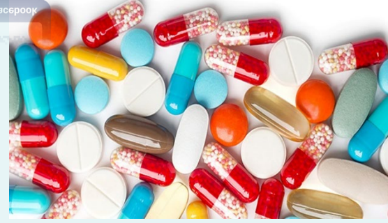
β阻斷劑/利尿劑 抗心律不整藥物 口服A酸/癌症藥 HIV/器官移植藥