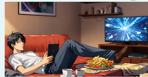
缺乏活動 Physical inactivity