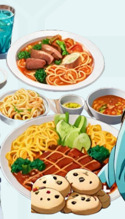
含糖飲料 精緻澱粉 反式脂肪 水果過量