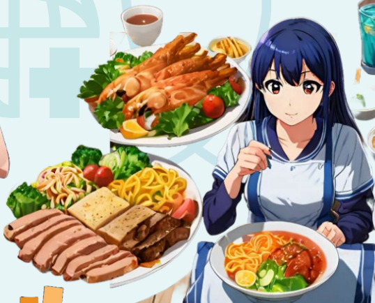
高熱量飲食 飽和脂肪過多 炸物紅肉肥肉