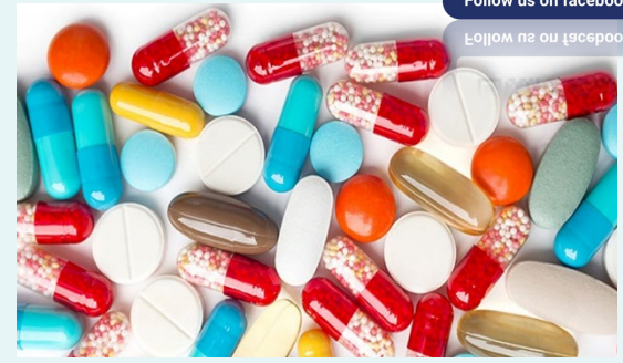
β阻斷劑/利尿劑 類固醇/雌激素 抗精神病藥物 HIV藥物